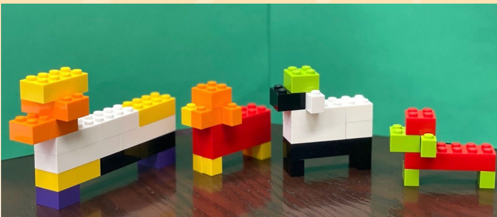
Projets de construction terminés : (de g. à dr.) équipe Violette, équipe Bleue, équipe Verte, équipe Mandarine

Après avoir discuté des thèmes mentionnés dans le sondage sur les priorités , le CS et le CC sont parvenus à parachever la liste des questions de bien-être prioritaires (QBEP) pour les moutons . Au cours de l'année à venir, le CS étudiera et résumera les données scientifiques disponibles sur ces questions.