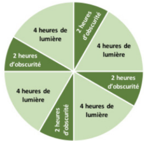
Figure 1.1: Exemple de programme d'éclairage intermittent.

La communication et la coordination entre les éleveurs de poulettes et les producteurs d'œufs peuvent faciliter la transition vers le bâtiment de ponte. Voir la section 5.1 : Approvisionnement en poulettes et transition vers la ponte pour plus de détails.