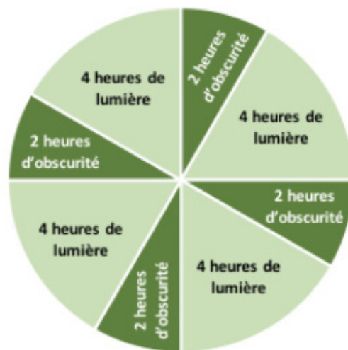
Figure 1.1: Exemple de programme d'éclairage intermittent.

La communication et la coordination entre les éleveurs de poulettes et les producteurs d'œufs peuvent faciliter la transition vers le bâtiment de ponte. Voir la section 5.1 : Approvisionnement en poulettes et transition vers la ponte pour plus de détails.